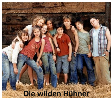
Die wilden Hühner

Do. 13. August um 18:00 Uhr für Kinder ab der 4. Klasse